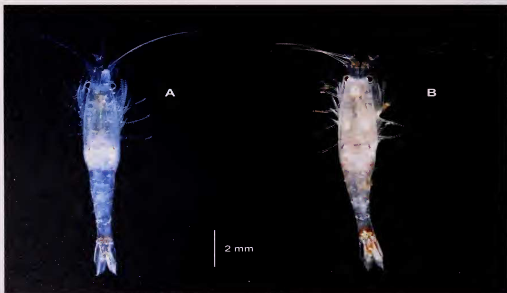
Lámina 1.- Gastrosaccus roscoffensis de Tenerife, aspecto general de ♀♀ ovígeras: A. Con cromatóforos contraídos; B. Con cromatóforos ligeramente expandidos.